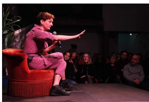
Extrait de « Sensible » présentation de 15' au cabaret des Chahuteuses